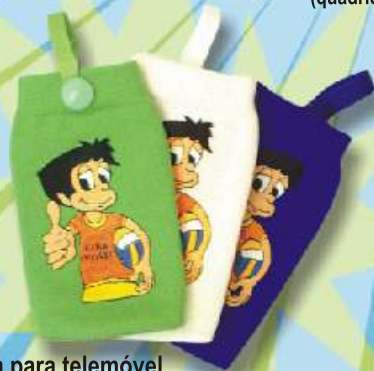
Bolsa para telemóvel 3€