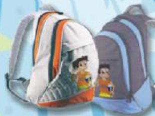
Mochila Gira-volei 20€