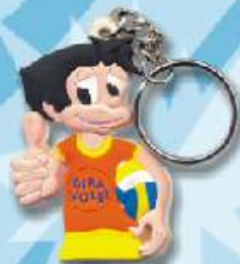
Porta-Chaves Gira-Volei 2,5€