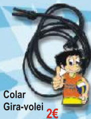
Colar Gira-volei 2€

os preços incluem IVA à taxa legal em vigor