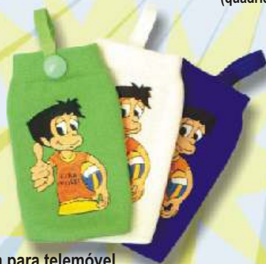
Bolsa para telemóvel 3€