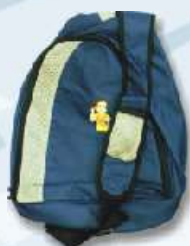
Mochila Gira-volei 10€