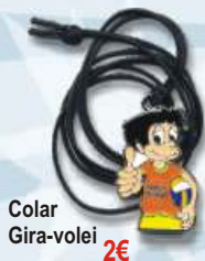
Colar Gira-volei 2€

os preços incluem IVA à taxa legal em vigor