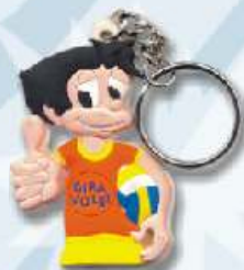
Porta-Chaves Gira-Volei 2,5€