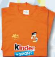
T-Shirt Gira-Volei 5€