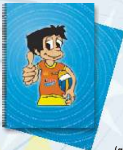
2€ Caderno Escolar A4 (quadriculado)