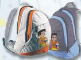
Mochila Gira-volei 20€