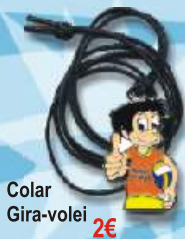
Colar Gira-volei 2€

os preços incluem IVA à taxa legal em vigor