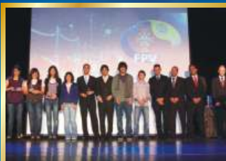
Vencedores do Gira+