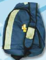
Mochila Gira-volei 10€