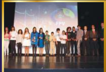
Vencedores do Gira-Volei